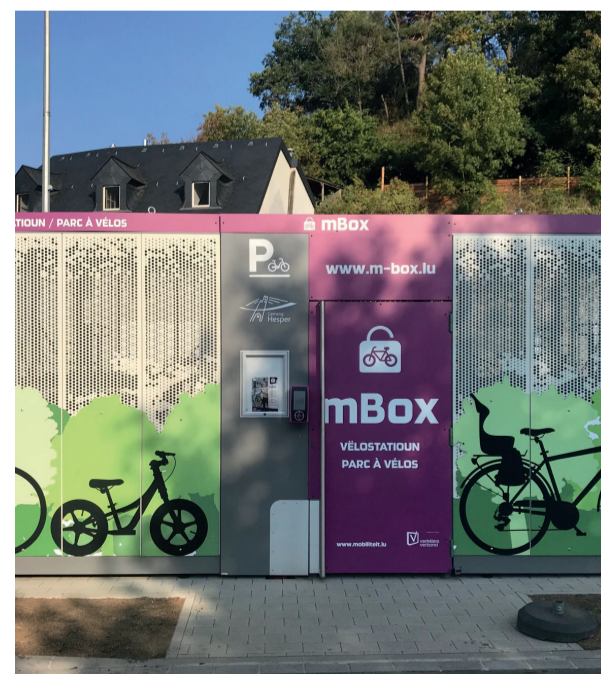
Nei mBox op der Place Jomé zu Hesper.

Nos représentants du Collège des bourgmestre et échevins et du conseil communal feront tout leur possible dans les années à venir pour assurer la meilleure qualité de vie possible dans notre Commune.